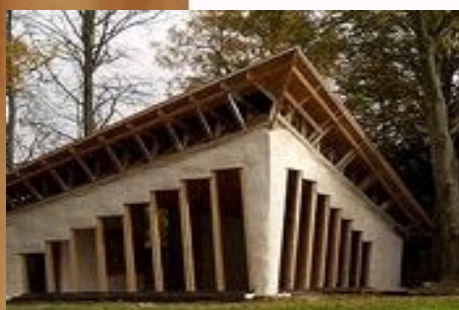
chantier Steen Moller

Thèmes - la paille porteuse - la pré-fabrication et filière sèche.