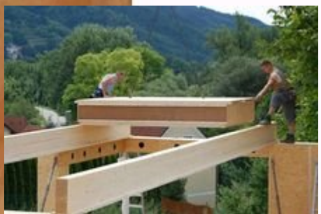
Préfabrication Herbert Gruber